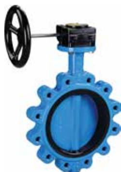
BWGE (蝶板: 球墨铸铁)