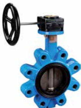
BWGX (蝶板: 不锈钢)